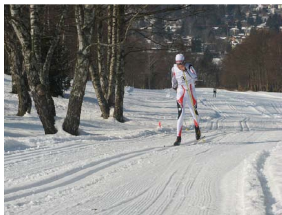
Figura 13 Lezione di sci