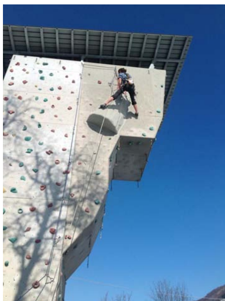
Figura 4 La Torre di arrampicata di Laino