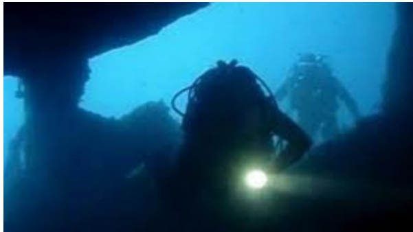
Fig 11 Immersione nel Lago