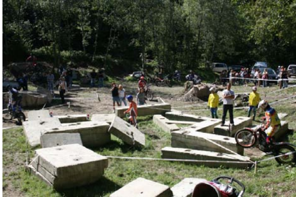
Figura 6 Trial Park di Lanzo