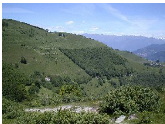
Figura 1 Trekking in Val d'Intelvi, da Orimento al Monte Generoso