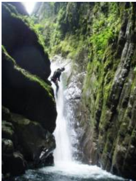
Figura 7 Torrente Lirone, discesa Canyoning