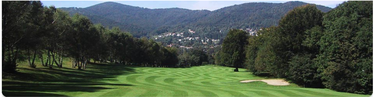
Figura 5 Un campo del Golf Club di Lanzo