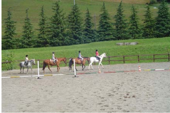
Figura 3 Una lezione di Equitazione