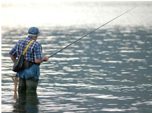
Figura 8 Un Pescatore del Lago di Como