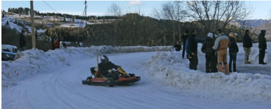
Figura 17 Adrenalina pura sulla pista di Snow Kart