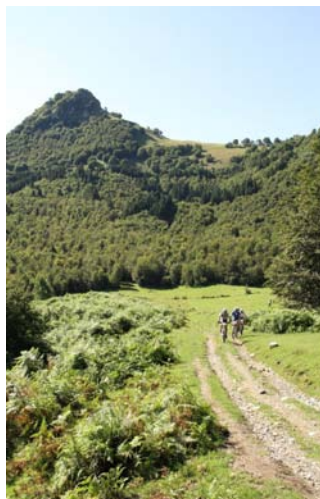
Figura 2 Sentieri in Mountain Bike