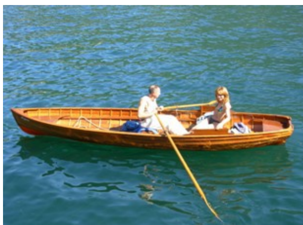
Figura 10 Una delle barche noleggiabili sul Lago di Como