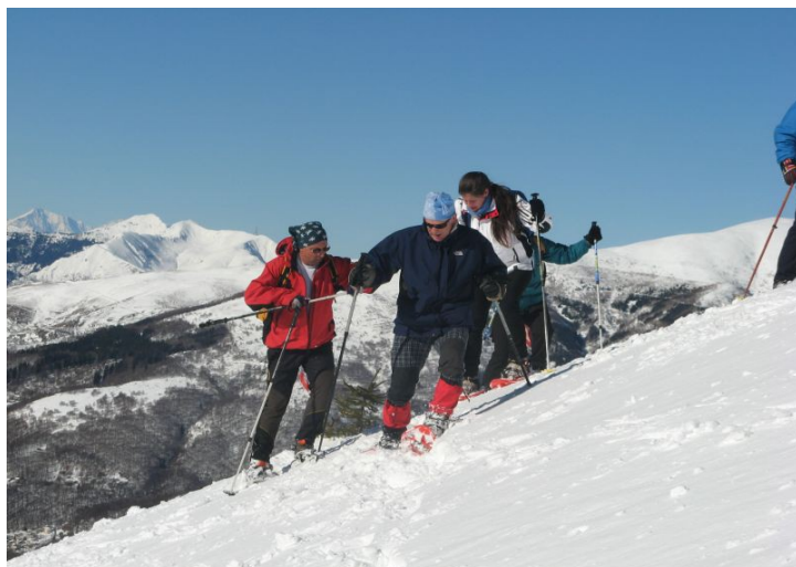
Figura 15 Una divertente ciaspolata tra i monti intelvesi