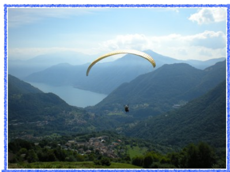
Figura 12 Il Panorama della Val d'Intelvi dal Parapendio