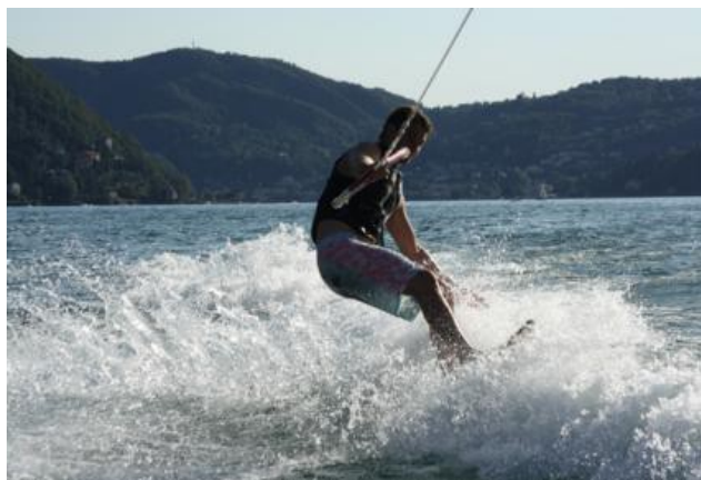
Figura 9 Wakeboard sulla acque del lago