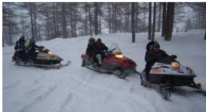
Figura 16 Escursione in Motoslitta