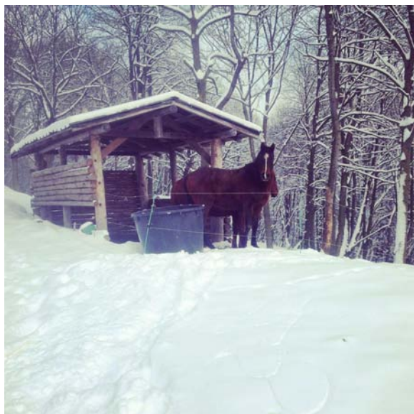
Figura 18 Equitazione in Val d'Intelvi, i cavalli si riparano da neve e freddo.